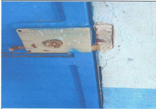
Foto1: panorama de reparación de puertas